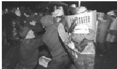
Междуреченск - ОМОН против шахтёров