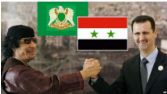
Муаммар Каддафи и Башар Асад ЗАЩИТНИКИ ОТЕЧЕСТВА

Но если в угоду капиталу необходимо начать войну, то повод для её развязывания всё равно будет найден. Набор таких поводов может быть самым разнообразным – «бактериологическое оружие» в Ираке (которого там не было), «диктаторский режим» в Ливии (на самом деле там